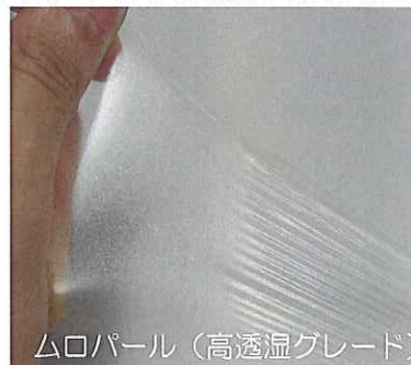
ムロパール（高透湿グレード）